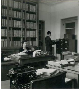
Sala de arquivo e secretaria do Ministério da Agricultura

A preocupação em reunir os documentos, organizá-los, conservá-los e registá-los para preservar a história das atividades relacionadas com a vida de uma instituição pode ser captada através da fotografia