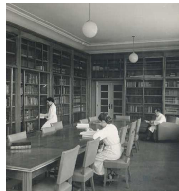
Biblioteca da Estação Agronómica Nacional do Ministério da Agricultura, 1953