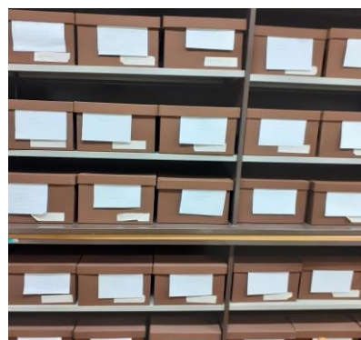
Foto de caixas de arquivo do Centro de Formação e Produção de Audiovisuais da SG MA