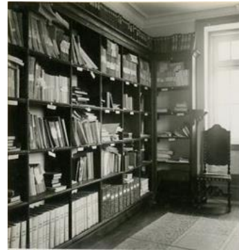
Biblioteca do Ministério da Agricultura