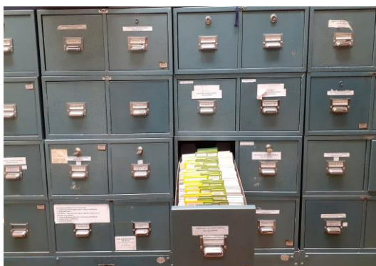
Foto de arquivador de gavetas com fichas e fotos do Centro de Formação e Produção de Audiovisuais da SG-MA