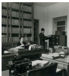
Sala de arquivo no Ministério da Agricultura. 1953 Acervo GPP

Ao longo da evolução do Ministério da Agricultura, desde a sua criação em 1918, a organização dos arquivos refletiu a falta de regulamentação e orientações específicas. A forma como os serviços e organismos organizaram os seus arquivos, apresentou vários condicionantes que determinaram a sua estruturação, consequência da dificuldade em integrar os conceitos associados ao planeamento organizacional e a inexistência de boas práticas arquivísticas.