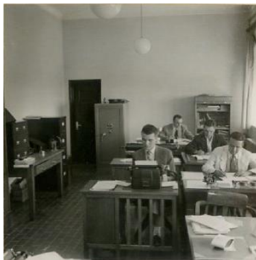
Secretaria e arquivo do Ministério da Agricultura