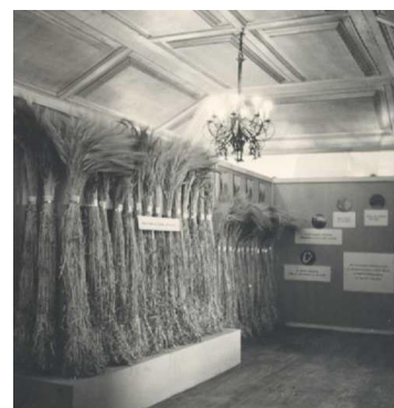
Exposição Agropecuária – Brigada Técnica de XIV Região – Beja. Foto de Carlos Ribeiro, 1954