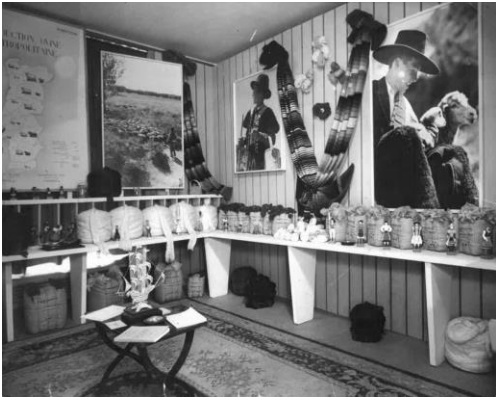
Campanha de valorização das lãs nacionais, JNPP, 1949