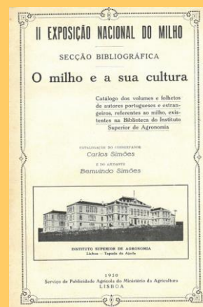
II Exposição Nacional do Milho / Serviço de Publicidade Agrícola do Ministério da Agricultura, 1930

Tendo como objetivo o desenvolvimento económico da agricultura e a modernização do sector, o Ministério da Agricultura, difundiu ao longo do tempo, o conhecimento científico e tecnológico para a sociedade. Procedeu à divulgação e propaganda da informação através da publicação nomeadamente de bibliografia, jornais e boletins, a realização e participação em conferências científico-pedagógicas, exposições, feiras nacionais, regionais, campanhas de divulgação, cursos de formação, aprendizagem técnica dos agricultores. A inovação técnica, a mecanização, a criação da Junta do Fomento Agrícola em 1920, os laboratórios de tecnologia florestal e agrícola integrados no ISA em 1926, são exemplos dessa atuação.