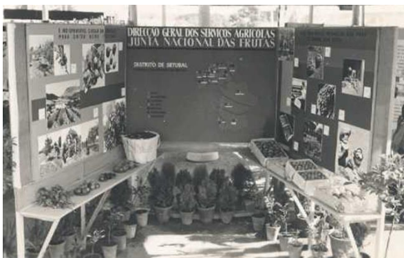
Exposição de fruticultura de Setúbal, 1954