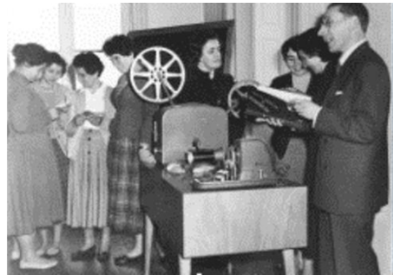
Alunas de um curso de extensão agrícola familiar. Projeção de filmes e de slides, 1964