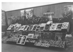
1ª Exposição de frutas, produtos hortícolas e Azeitonas no salão das Belas-Artes. Anos 30 do séc. XX.